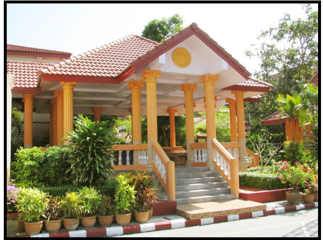
ศาลานั่งพักผ่อน