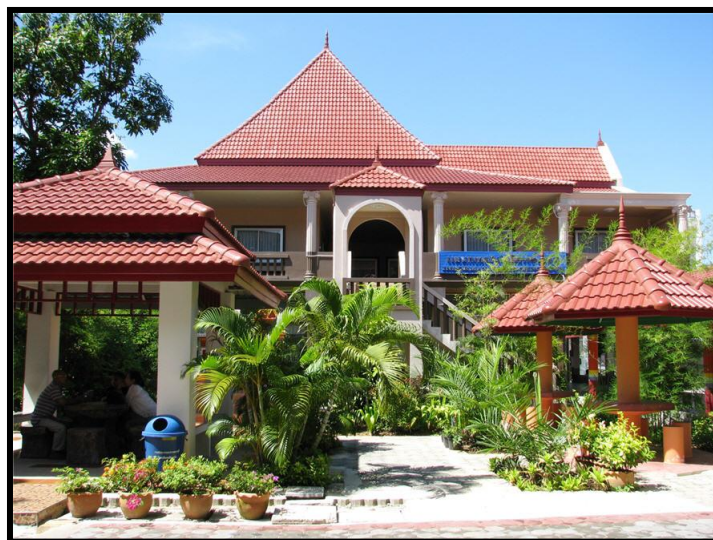
แผนกวิชาเทคโนโลยี