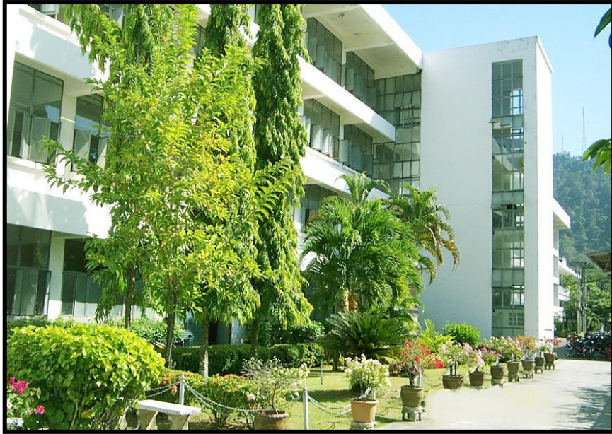
แผนกเทคนิควิศวกรรมหมืองแร่และสิ่งแวดล้อม และแผนกเทคนิคพื้นฐาน