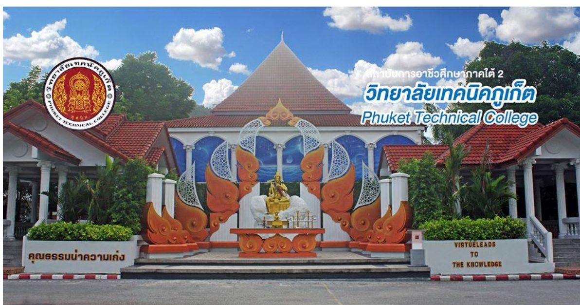
บริเวณลานหลวงปู่และพระวิชฌุกรม