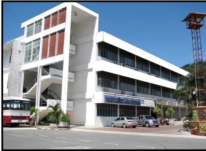
แผนกวิชาช่างกลโรงงาน