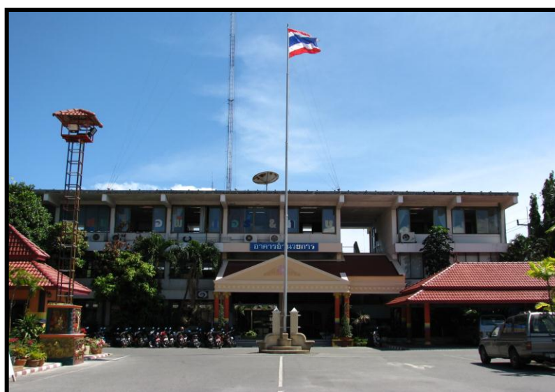
อาคารอำนวยการ