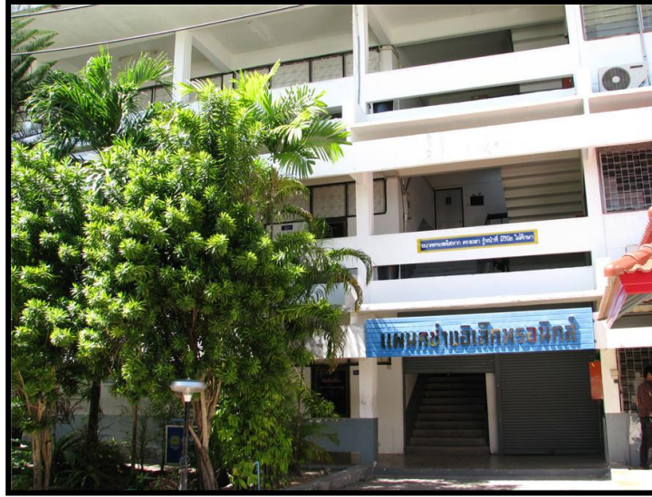
แผนกวิชาช่างอิเล็กทรอนิกส์