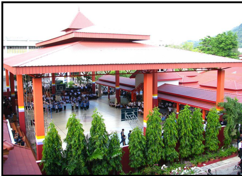
อาคารอยู่สี่มาร์กซ์