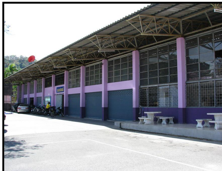
แผนกวิชาช่างยนต์