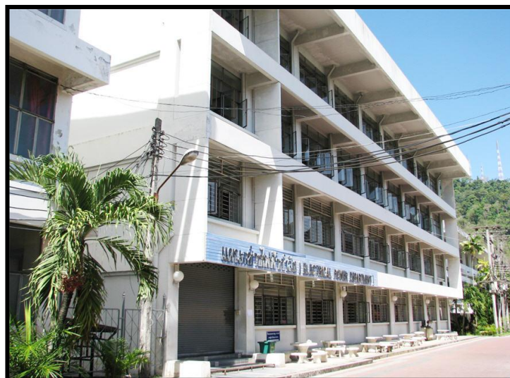
แผนกวิชาช่างไฟฟ้า