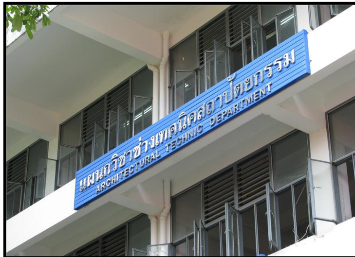
แผนกวิชาช่างเทคนิคสถาปัตยกรรม