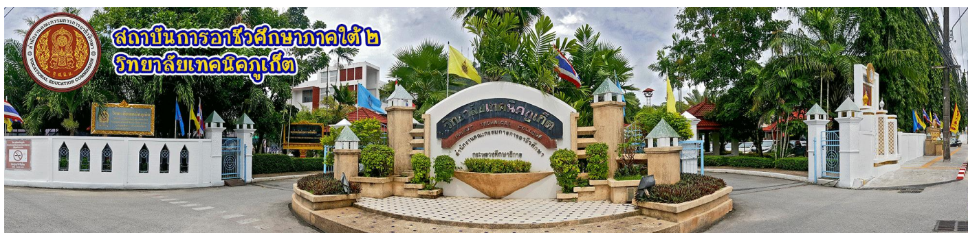
ป้ายวิทยาลัยเทคนิคภูเก็ต