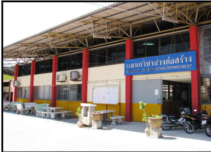
แผนกวิชาช่างก่อสร้าง