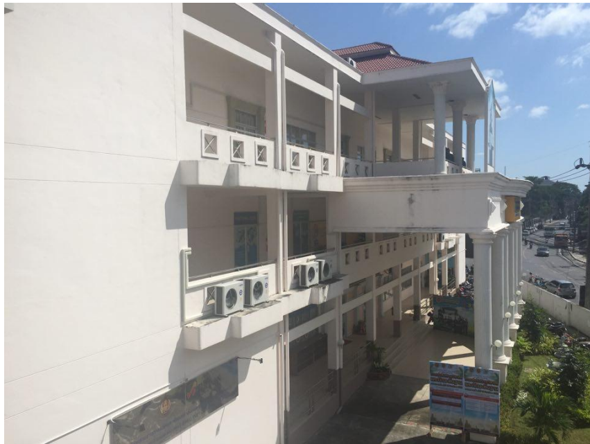
อาคารวิทยบริการและห้องสมุด