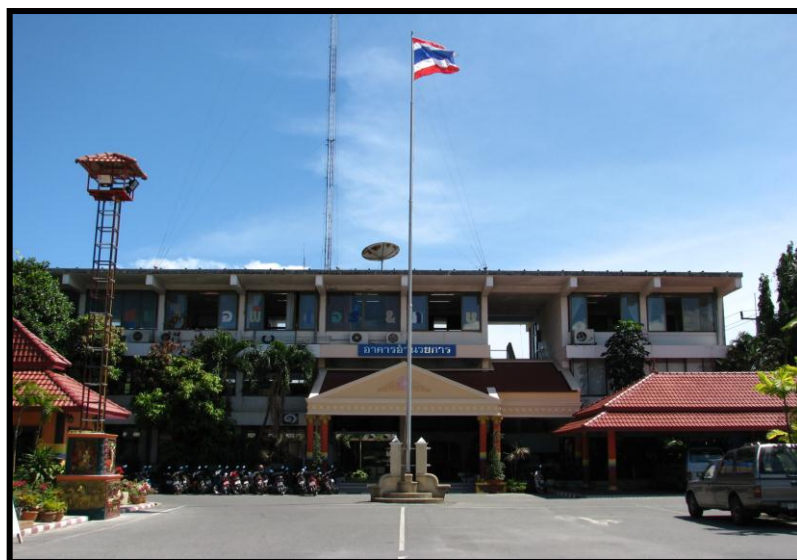
อาคารอำนวยการ