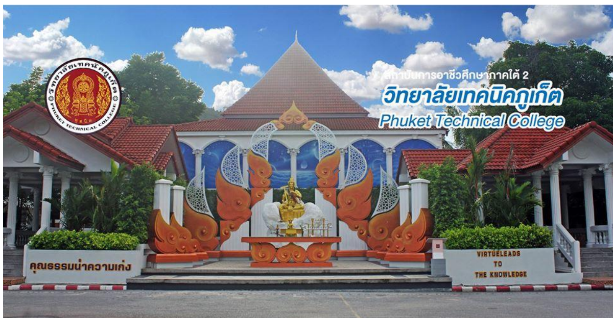
บริเวณลานหลวงปู่และพระวิชฌุกรม