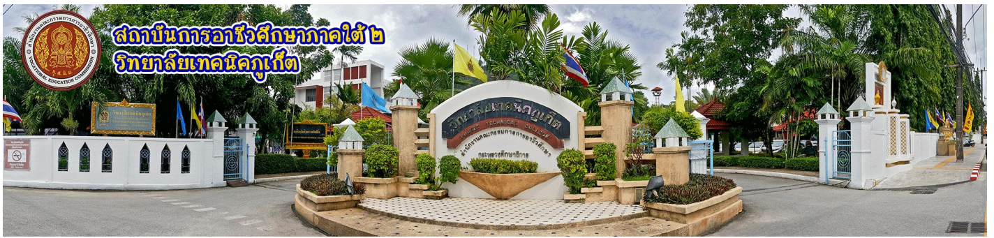
ป้ายวิทยาลัยเทคนิคภูเก็ต